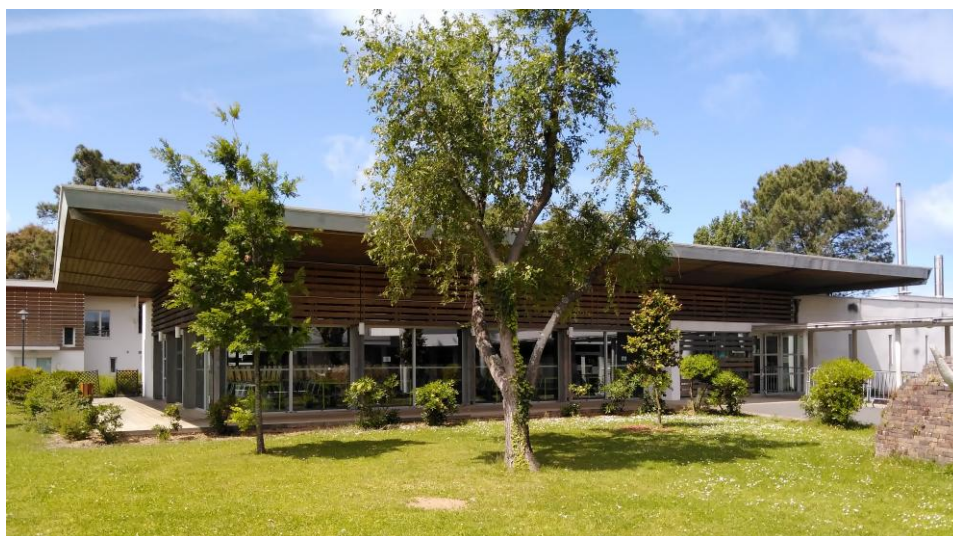
Le bâtiment du restaurant scolaire