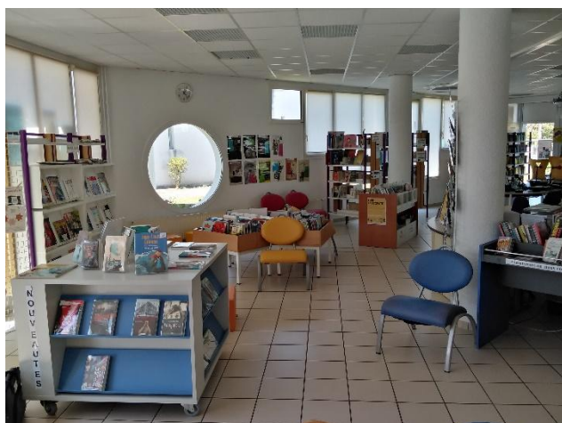
Le CDI (Centre de Documentation et d'Information)

Les enseignements optionnels : en 6 ème l'option Français et culture antique peut être choisie (2 heures par semaine) ; à partir de la classe de 5 ème , les élèves peuvent prendre l'enseignement de Langues et cultures de l'Antiquité – Latin : 1 heure en 5 ème , 2 heures en 4 ème et 2 heures en 3 ème .