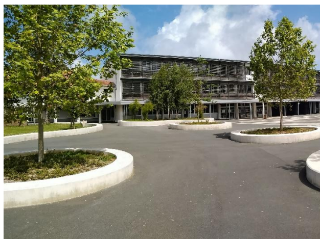
La cour du collège