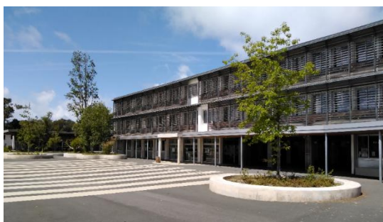
Le bâtiment principal

Ils soutiennent et aident à développer les usages numériques des enseignants au travers de formations et d'accompagnement. Ils contrôlent, supervisent et maintiennent les infrastructures réseaux et le parc des matériels informatiques à jour.